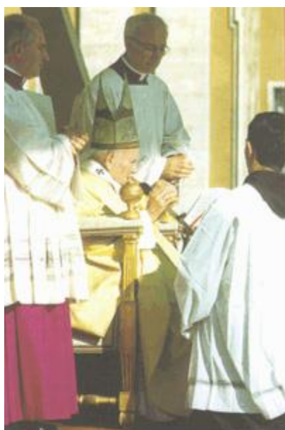
John Paul II proclaims Theresia of the Child Jesus a Doctor of the Universal Church.