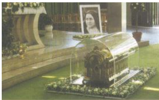
The relics of Theresia in the church of the Ugandan Mar