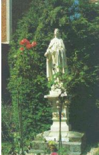
Lisieux. Carmel. Statue of St Therese in the inside cloister.