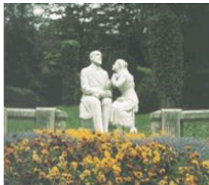
Lisieux. Les Buissonnets statues in the garden representing the scene which Therese on Pentecost Sunday, 29-5-1887, requested permission from her father to enter Carmel.

「愛」和「德蘭」是分不開的；記得教宗保祿六世曾說：「小德蘭一生熱愛天主，在天主的注視下，在細事中渡過了她的每一天，她在天主面前行走，將一生歲月做成與她『最可愛者』間的